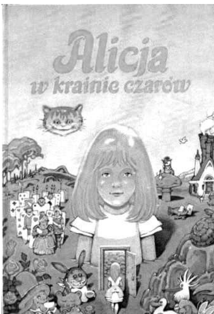
Okładka jednego z wydań „Alicji w krainie czarów”