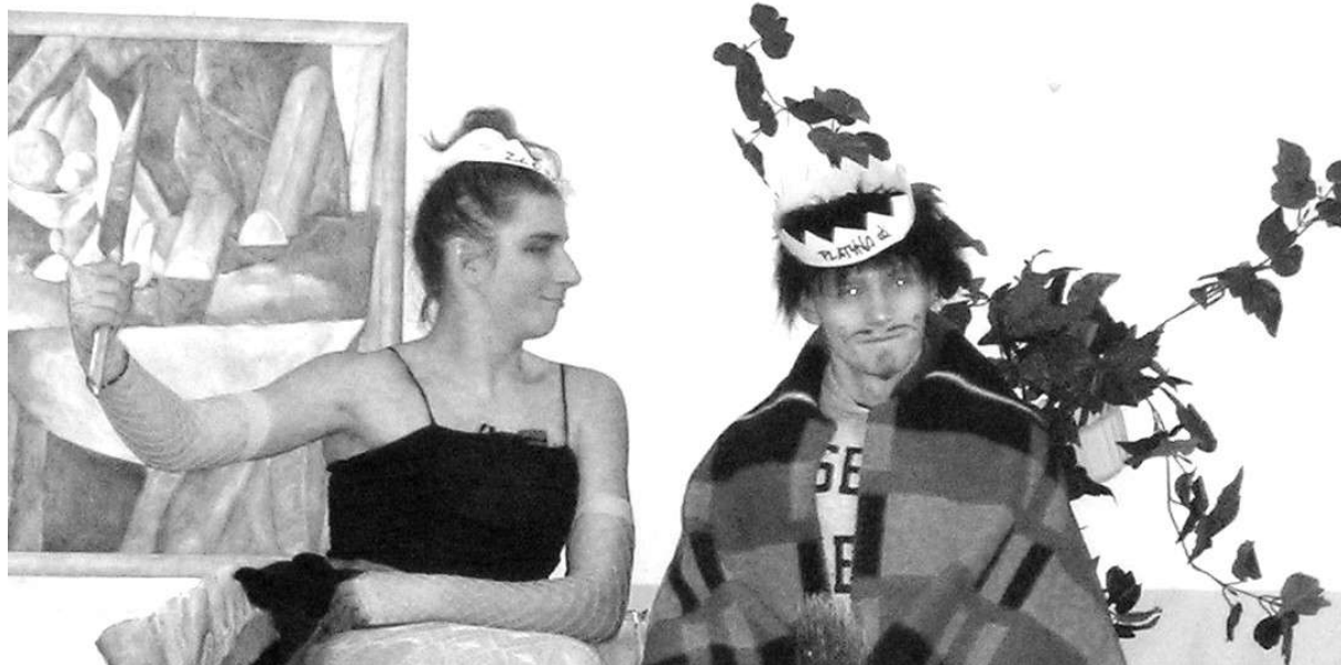
Król i Królowa otrzęsin.

Rozpoczęło się ponad godzinne szaleństwo, z którego kilka zdjęć Wam prezentujemy. To trzeba było zobaczyć, a jeszcze lepiej przeżyć!